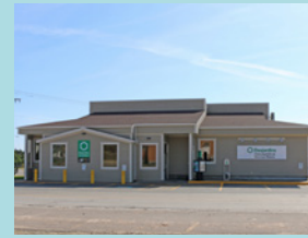
Centre de services de Havre-aux-Maisons