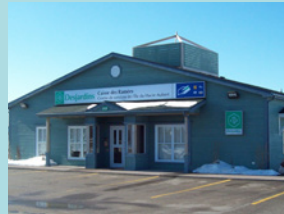
Centre de services de L'Île du Havre-Aubert