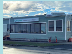
Centre de services de Fatima