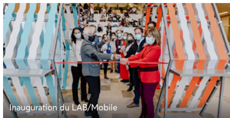
Inauguration du LAB/Mobile

Agir ensemble est un fondement propre au modèle coopératif qui aide à façonner un avenir meilleur. Étant donné la persistance de la pandémie et de tous ses effets, nous avons poursuivi nos nombreuses initiatives pour soutenir les collectivités et favoriser une reprise économique plus verte et plus inclusive.