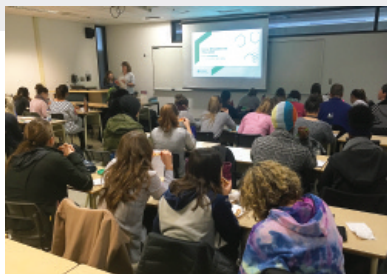
Conférence sur l'éducation financière à l'UQAM, en collaboration avec l'Association modulaire étudiante du Baccalauréat en enseignement au secondaire (AMEBES).

Nous remercions les 360 d de l'Université de Concordia, de l'Université de Montréal et de l'Université du Québec à Montréal (UQAM) pour leur collaboration et l'accompagnement offerts à nos étudiants pour la réalisation de leurs projets.