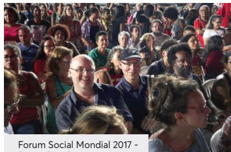
Forum Social Mondial 2017 - Rio au Brésil