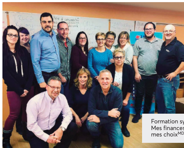
Formation syndicale Mes finances, mes choix MD