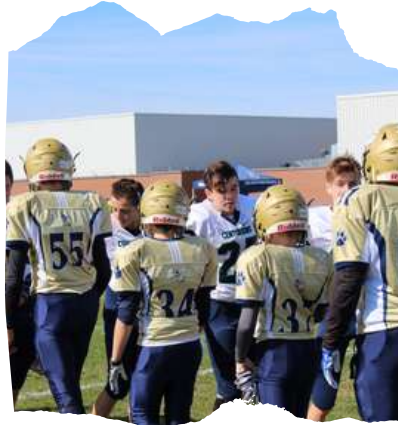
Financement nouveaux casques Équipe football Le Husky