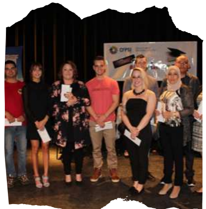
Bourses d'excellence CFP de Sept-Îles