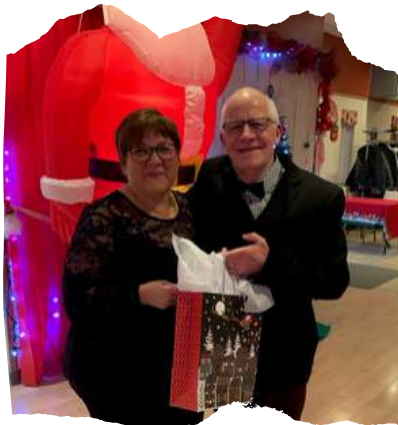
Soirée de Noël Produits Forestiers Résolu