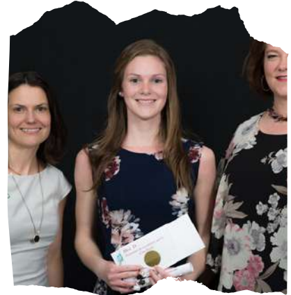
Bourses d'excellence Cégep de Sept-Îles