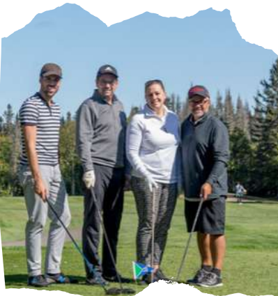
Tournoi de golf Aluminerie Alouette