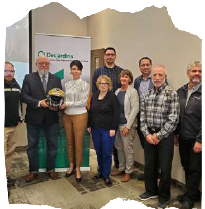
Conférence de presse investissements FADM