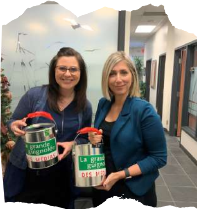
Collecte et décompte des dons Guignolée des médias