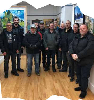
Nez Rouge Aluminerie Alcoa Baie-Comeau