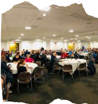
Déjeuners Caisses de groupe Congrès FTQ