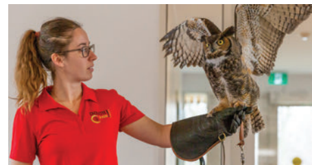
45 000 $ remis à l'Union québécoise de réhabilitation des oiseaux de proie depuis 2017