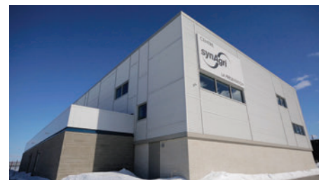
15 000 $ remis à la municipalité de La Présentation pour l'aider à bâtir le Centre synAgri

secteur et continuera d'appuyer les diverses initiatives collectives grâce à son Fonds d'aide au développement du milieu.