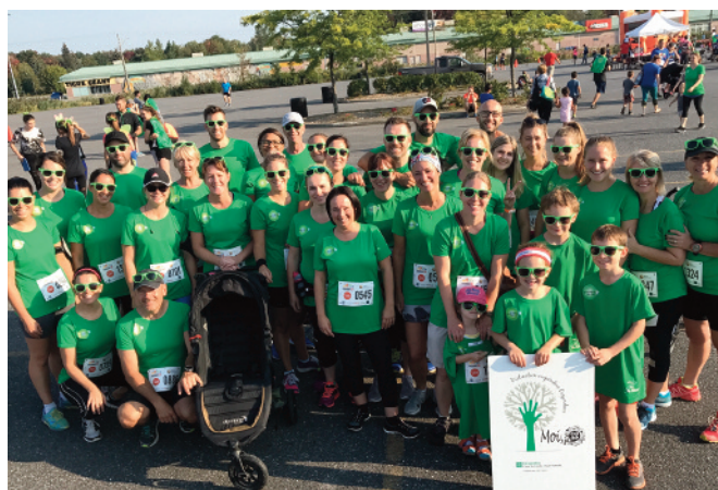
LE 5 KM ZOO