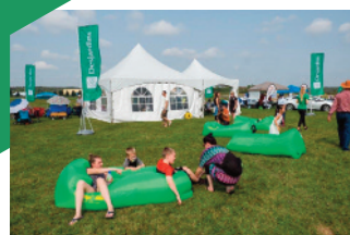
SPECTACLE ET SALON AÉRIEN DES CANTONS-DE-L'EST