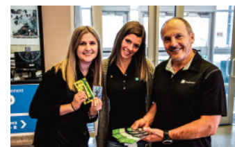
SEMAINE DE LA COOPÉRATION