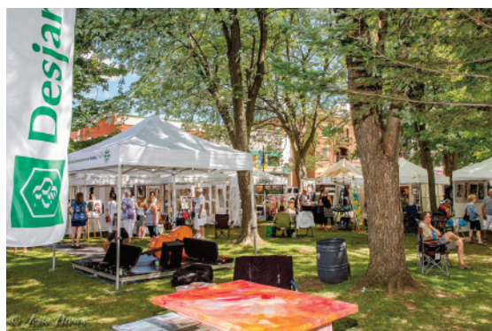
SYMPOSIUM COULEURS URBAINES