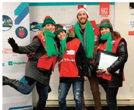
OPÉRATION NEZ ROUGE