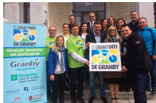
GRAND DÉFI DE GRANBY