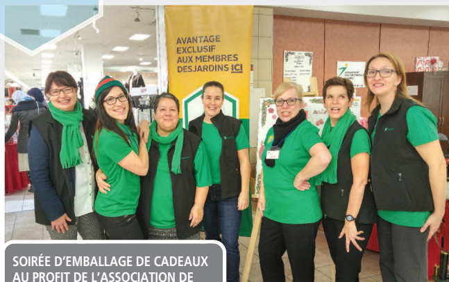
SOIRÉE D'EMBALLAGE DE CADEAUX AU PROFIT DE L'ASSOCIATION DE PARALYSIE CÉRÉBRALE