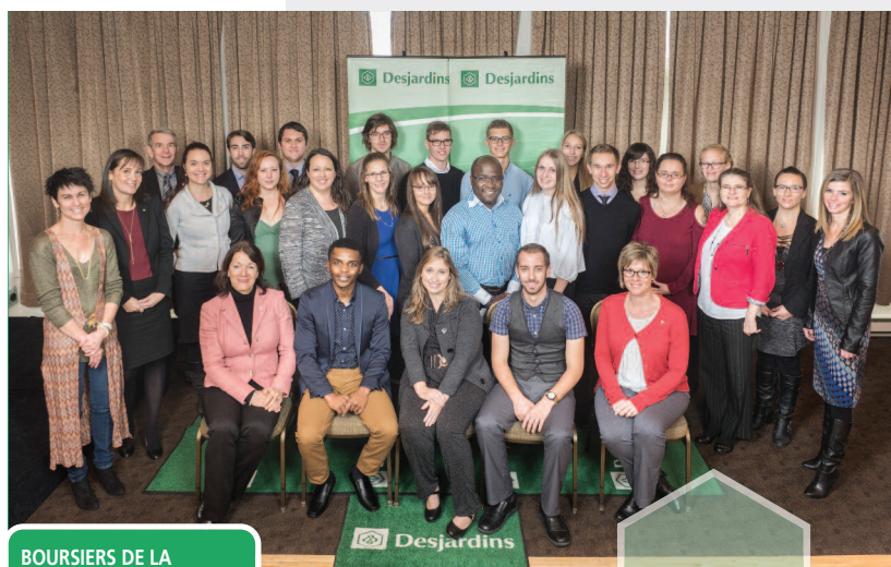
BOURSIERS DE LA FONDATION DESJARDINS