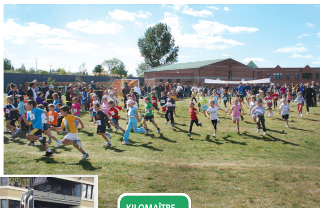
KILOMÈTRE DE BROMONT

Solidarité Ethnique Régionale de la Yamaska