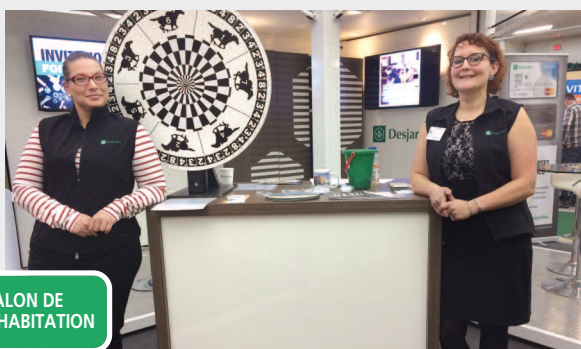
SALON DE L'HABITATION