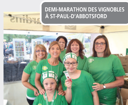
DEMI-MARATHON DES VIGNOBLES À ST-PAUL-D'ABBOTSFORD