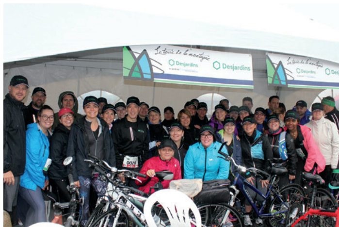
Tour de la Montagne Desjardins – Édition 2019

La Caisse est fière d'annoncer un partenariat entre la Fondation Honoré-Mercier et les caisses de la Région de Saint-Hyacinthe, de la Vallée d'Acton, de Beloeil-Mont-Saint-Hilaire et du Mont-Saint-Bruno. Ce regroupement des caisses remettra la somme de 150 000 $ sur 3 ans à la Fondation. Rappelons que celle-ci se veut un levier de développement pour l'Hôpital Honoré-Mercier depuis 1982. Ce nouveau partenariat servira, entre autres, à financer l'achat d'équipements chirurgicaux orthopédiques afin de permettre des chirurgies dorsales de fine pointe. Grâce à ce partenariat, de nombreux patients pourront être traités à même l'hôpital plutôt que de devoir être soignés à l'extérieur de la région. Les Caisses Desjardins s'impliquent en tant que grand donateur auprès de la Fondation Honoré-Mercier depuis maintenant 30 ans à travers différents événements tels que le Tour de la Montagne Desjardins et le Tournoi de Golf & Gastronomie.