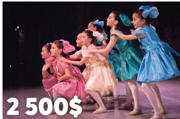
2 500$ au Ballet classique du Haut-Richelieu