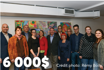
6 000$ à Action Art Actuel pour les ateliers créatifs « Les Impatients »