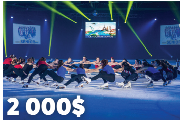
2 000$ au Club de Patinage artistique St-Jean