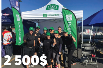
2 500$ pour le Tour de force BMR au profit de l'Éclusier du Haut-Richelieu