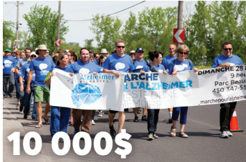
10 000$ pour la Marche pour l'Alzheimer de la Société Alzheimer du Haut-Richelieu