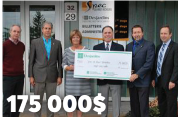
175 000$ sur 7 ans, à la Société pour la promotion d'événements culturels du Haut-Richelieu 1