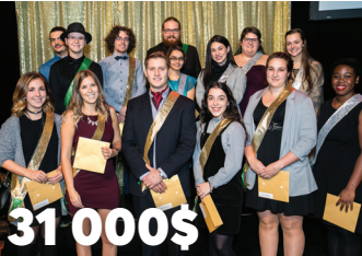
31 000$ remis en bourses d'études lors du Chic Gala de la Caisse Desjardins du Haut-Richelieu