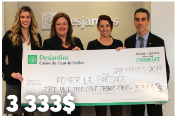
3 333$ au Foyer Le Passage 1