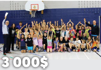
3 000$ à l'École Aux-Quatre-Vents, pour la « Grande randonnée AQV » au parc du Mont Orford 2