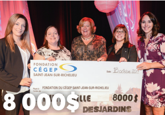
8 000$ en bourses d'études pour le Gala du mérite collégial du Cégep Saint-Jean-sur-Richelieu 1