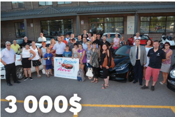
3 000$ à la Fondation Le Renfort Grande Ligne