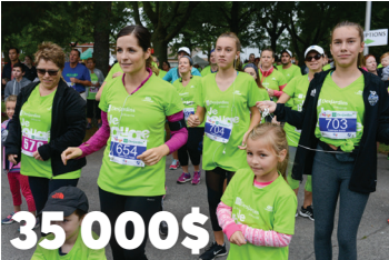
35 000$ pour le Défi Je Bouge de la Fondation Santé Haut-Richelieu – Rouville 1