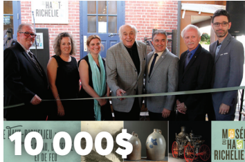
10 000$ au Musée du Haut-Richelieu