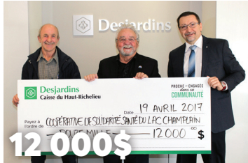
12 000$ à la Coopérative de solidarité santé du Lac Champlain