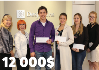
12 000$ Six de nos membres se partagent 12 000$ en bourses d'études de la Fondation Desjardins