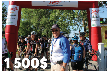
1 500$ pour le Circuit cycliste du Lac Champlain