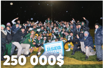
250 000$ sur 10 ans, au Stade de soccer-football Alphonse-Desjardins