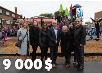
9 000 $ à l'École Bruno Choquette pour la revitalisation de la cour d'école et le projet « Cuisinons nos collations » 2