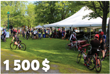
1 500 $ pour le Circuit cycliste du Lac Champlain