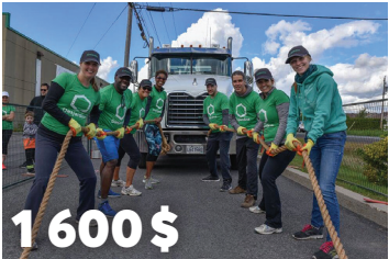
1 600 $ au Tour de force BMR au profit de l'Écluser du Haut-Richelieu