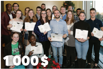
1 000 $ en bourses aux étudiants en Gestion et technologies d'entreprises agricoles