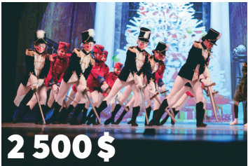
2 500 $ au Ballet classique du Haut- Richelieu