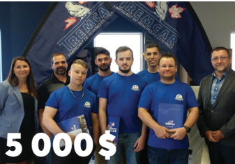
5 000 $ en bourses aux étudiants finissants de Tremcar