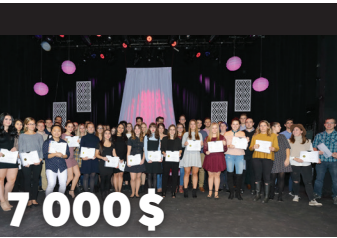
7 000 $ en bourses d'études pour le gala du mérite collégial du Cégep Saint-Jean-sur-Richelieu 1