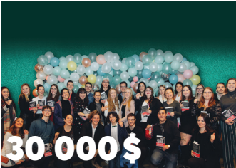
30 000 $ en bourses d'études lors de La soirée jeunesse