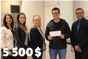
5 500 $ en bourses d'études de la Fondation Desjardins partagé entre trois de nos membres