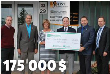
175 000 $ sur 7 ans, à la Société pour la promotion d'événements culturels du Haut-Richelieu 1