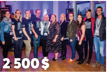
2 500 $ à Loisir et sport Montérégie pour les Rendez-vous québécois du loisir rural