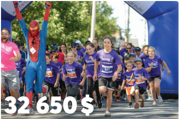
32 650 $ pour le Défi Je Bouge de la Fondation Santé Haut- Richelieu-Rouville 1