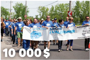
10 000 $ pour la marche pour l'Alzheimer du Haut-Richelieu