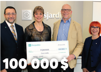
100 000 $ à la Fondation québécoise de la maladie d'Alzheimer et des maladies apparentées pour le projet Faubourg Soins et Sérénité 3