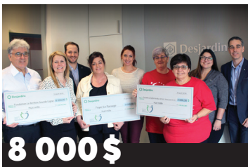
8 000 $ à la Fondation Le Renfort Grande Ligne 1