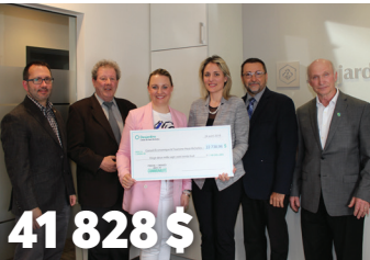
41 828 $ au Conseil économique & Tourisme Haut-Richelieu pour l'étude de faisabilité et le plan d'affaire pour le marché des drones civils