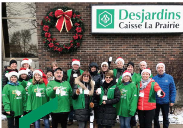
L'escouade de la Caisse est prête pour passer la guignolée dans les rues de La Prairie!

Grâce au généreux soutien de la Caisse de 3 000 $ offert au Club Optimiste La Prairie, des paniers de Noël ont été confectionnés et remis à des familles dans le besoin. Au total, 12 700 $ ont été recueillis et 39 300 denrées ont été amassées.