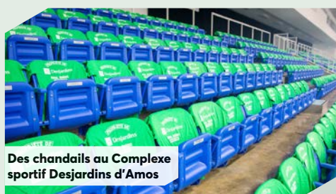
Des chandails au Complexe sportif Desjardins d'Amos