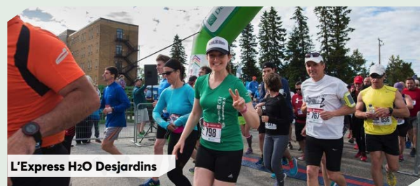
L'Express H2O Desjardins