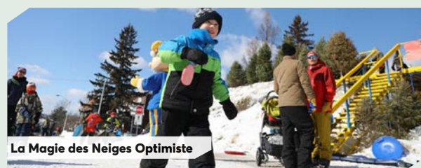
La Magie des Neiges Optimiste