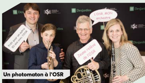
Un photomaton à l'OSR