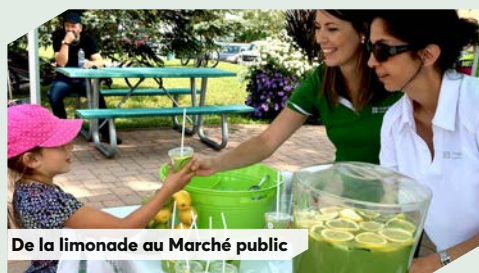
De la limonade au Marché public

Votre caisse a organisé plusieurs activités Avantages membre Desjardins surprises et remis de nombreux prix et cadeaux à ses membres afin de les remercier de leur fidélité.