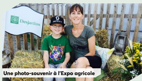
Une photo-souvenir à l'Expo agricole