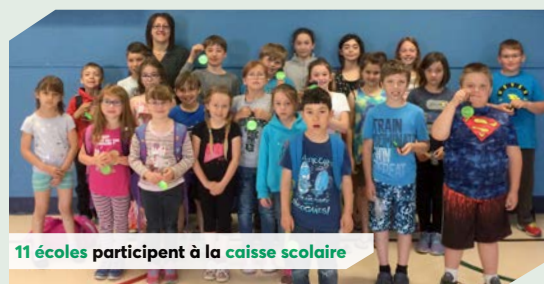
11 écoles participent à la caisse scolaire

En 2017, ce sont plus de 435 jeunes qui ont participé à la caisse scolaire dans 11 écoles primaires de notre secteur.