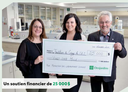
Un soutien financier de 25 000$

La Caisse est fière d'appuyer la Fondation du Cégep de l'Abitibi-Témiscamingue et de contribuer à la réfection des laboratoires du campus d'Amos à la hauteur de 25 000$ .