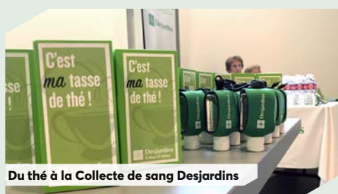
Du thé à la Collecte de sang Desjardins