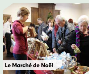
Le Marché de Noël