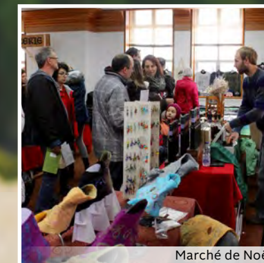
Marché de Noël