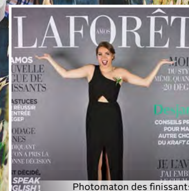
Photomaton des finissants