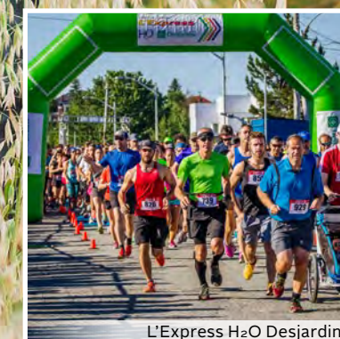
L'Express H 2 O Desjardins