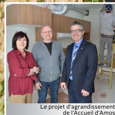
Le projet d'agrandissement de l'Accueil d'Amos