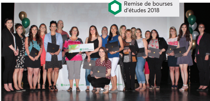
Remise de bourses d'études 2018

Nous accompagnons actuellement deux caisses étudiantes dans les écoles, soit à la Polyvalente des Quatre-Vents de Saint-Félicien et à la Cité Étudiante de Roberval.