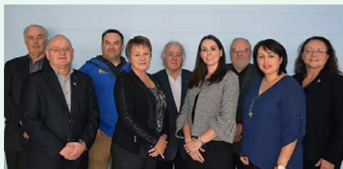
Sur la photo, les membres de la Fondation du Centre d'études collégiales du Témiscouata et les directrices et présidents des Caisses Desjardins du Portage et des Lacs de Témiscouata.

Les jeunes font avancer la société, appuyons-les! La Caisse populaire Desjardins du Portage en collaboration avec la Caisse Desjardins des Lacs de Témiscouata, annoncent avec fierté un appui financier de 50 000 $ sur trois ans au Centre d'études collégiales du Témiscouata.