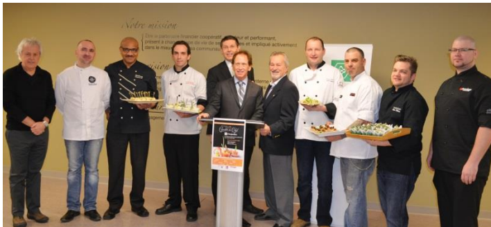
Conférence de presse lors du lancement du Souper opération des chefs Desjardins 2016 au profit de la Fondation Hôpital Memphrémagog