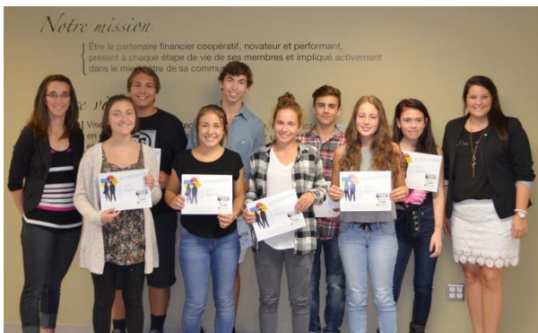
Desjardins jeunes au travail 2016 : 15 d'emplois d'été créés.