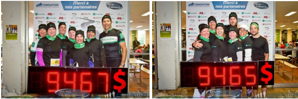
2 équipes de la Caisse amassent 20 000 $ pour la Fondation Christian vachon.