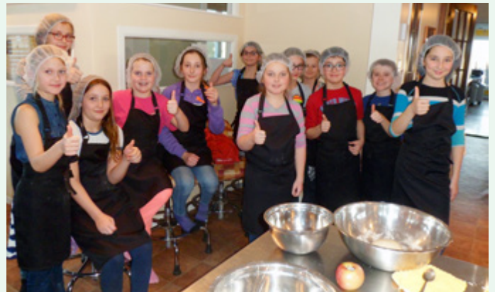
La Caisse des Sources est heureuse d'avoir permis à 12 jeunes de mettre en pratique leurs nouvelles connaissances culinaires.

Visant à enseigner les rudiments de base en cuisine ainsi que les saines habitudes alimentaires à des jeunes âgés entre 9 à 12 ans, Cuisine Amitié de la MRC des Sources en collaboration avec le Service des loisirs de la ville d'Asbestos ont mis en place une série de 10 cours de cuisine. La collaboration financière de la Caisse des Sources a permis de faire l'achat du matériel nécessaire à l'organisation de ces ateliers culinaires.