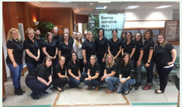
En octobre dernier, les gestionnaires et les employés de la Caisse ont appuyé cette campagne en donnant un montant pour participer à la Journée Jeans.

La Caisse des Sources et ses employés ont apporté leur support à la Campagne Centraide, entre autres, en revêtant leur denim lors d'une Journée Jeans.