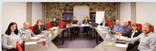
Votre conseil d'administration 2016

Nous certifions que le rapport annuel de la Caisse Desjardins des Sources pour l'année financière complétée au 31 décembre 2016 répond aux exigences de la Loi sur les coopératives de services financiers et qu'il a été dûment approuvé par le conseil d'administration de la Caisse.