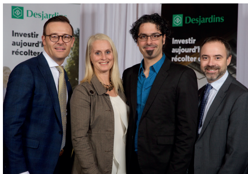
Appui financier accordé aux Créateurs de saveurs des Cantons-de-l'Est.

les Caisses de Sherbrooke font la différence dans leur milieu grâce à leurs contributions qui répondent aux besoins du milieu.