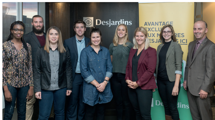
Bourses distribuées à des étudiants.