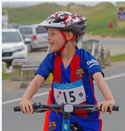
Les Îles à Vélo