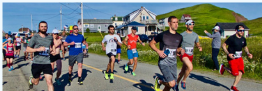
La 35 e édition du Madelicourons

Les caisses ont poursuivi leur partenariat pour l'organisation d'événements sportifs, culturels ou touristiques majeurs aux Îles-de-la-Madeleine au cours de 2018. Ces événements incluent notamment le Madelicourons, la Course à obstacles « T'as pas l'tchoeur », les Îles à Vélo, la Fête aux saveurs de la mer, le Concours des Châteaux de sable, le Concours des P'tits bateaux, le Symposium de peinture de l'Étang-du-Nord, etc.