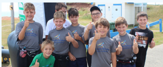
Les jeunes prêts à se lancer pour la course à obstacles « T'as pas l'tchoeur »