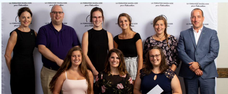
Lors de la remise des bourses Desjardins dans le cadre de l'événement de la Fondation Madeli-Aide tenu le 6 août 2018.

La Caisse a également continué d'appuyer financièrement de nombreux projets et organismes qui ont pour objectif d'aider les jeunes à bâtir leur avenir, comme la Fondation Madeli-Aide et le Groupe persévérance scolaire.