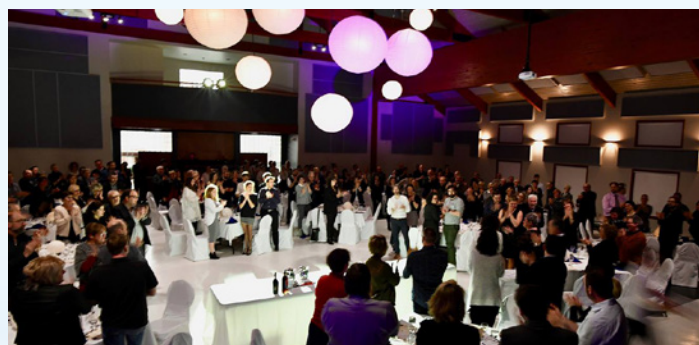
Les participants de la soirée « Dégustation découverte Desjardins » du 24 février 2018 au Centre récréatif de L'Étang-du-Nord.

Encore une fois cette année, les caisses des Îles ont octroyé leur soutien à la Fondation Santé de l'Archipel dans le cadre de l'événement « Dégustation découverte Desjardins ». Le rendez-vous festif a permis de recueillir 36 000 $ pour le CISSS des Îles.