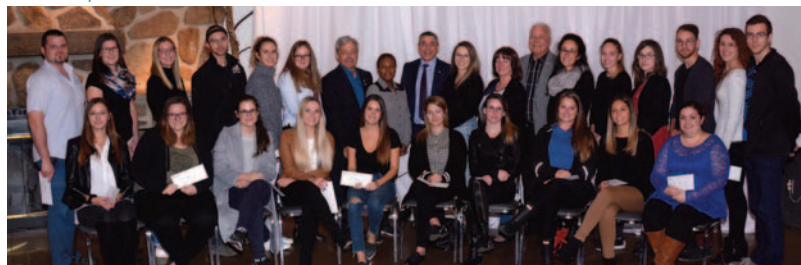
55 000 $ en bourses d'études