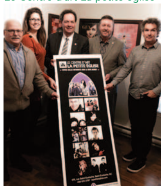
Le Centre d'art La petite église