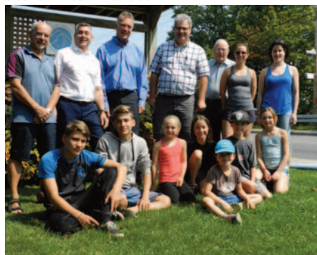
Camp de vacances aux enfants des familles sinistrées