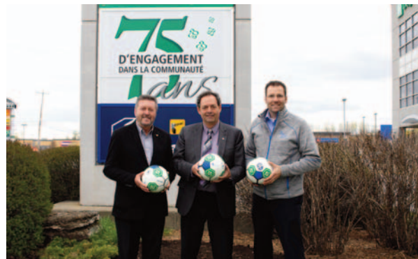
Association de soccer Saint-Eustache