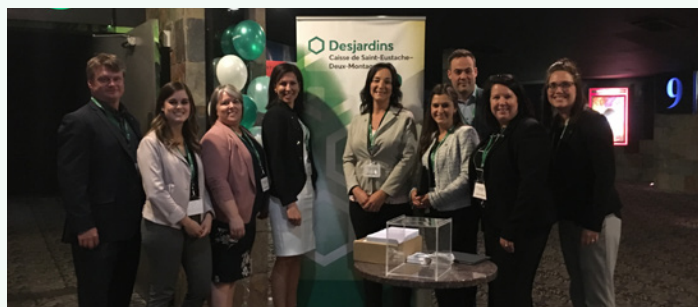
Le comité organisateur formé d'employés et de gestionnaires de la Caisse.

Le 16 mai 2019 s'est tenue une soirée toute spéciale pour les finissants de 5 e secondaire membres de la Caisse Desjardins de Saint-Eustache-Deux-Montagnes. Afin de célébrer cette étape d'importance ainsi que la poursuite de leurs études, nous leur avons remis quelques bourses, en plus de leur offrir la projection du film « Avengers » avec popcorn et friandises! Au total, 200 personnes étaient présentes et un peu plus de 90 bourses totalisant 11 350 $ ont été octroyées.