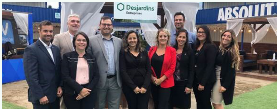
Nos partenaires Desjardins pour la commandite, soient les directeurs de comptes du Centre Desjardins Entreprises et les employés et directeurs des caisses de la MRC de Deux-Montagnes.

À titre de fier partenaire pilier de la Chambre de commerce de Deux-Montagnes, nous contribuons au développement économique et social de notre région. Desjardins a remis 25 000 $ à l'organisme en 2019.