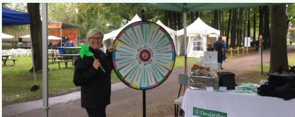
Nombreux employés et administrateurs ont donné de leur temps pour venir rencontrer nos membres lors du Festival.

La Caisse est fière d'être partenaire de la Corporation du Moulin Légaré, organisme responsable de la conservation du moulin et qui œuvre principalement et activement à la mise en valeur du patrimoine culturel du Vieux-Saint-Eustache. Nous étions présents et engagés lors du Festival de la galette et des saveurs du terroir qui accueille chaque année tout près de 20 000 visiteurs et pour lequel nous avons remis une contribution financière de 17 500 $.