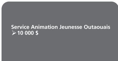
Service Animation Jeunesse Outaouais ➤ 10 000 $