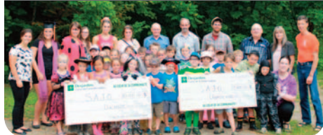
Activité Mérite-élève de l'École secondaire Hormisdas-Gamelin ➤ 1000 $