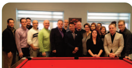
Ouverture officielle du Complexe Jeunesse M-Ado Jeunes ➤ 50 000 $

Directrice ressources humaines et communication