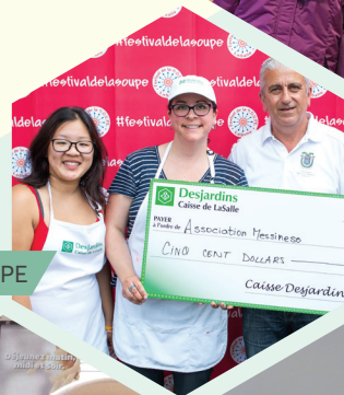
Festival de la S.O.U.P.E