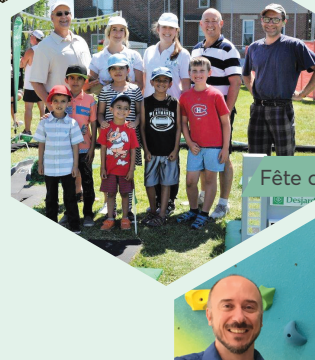
Fête de quartier - 375e de Montréal - Projet Viva Cité