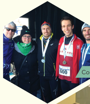
Course et Marche populaires de LaSalle