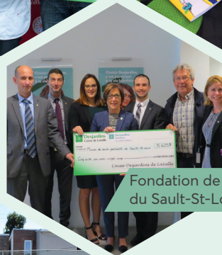
Fondation de la Maison de soins palliatifs du Sault-St-Louis