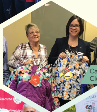
Campagne des habits de neige Club Optimiste des Rapides LaSalle