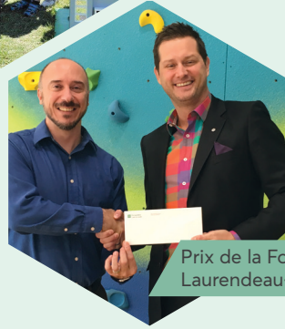
Prix de la Fondation Desjardins à l'école Laurendeau-Dunton