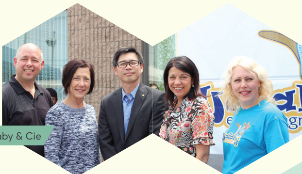
Wallaby & Cie