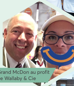
Grand McDon au profit de Wallaby & Cie