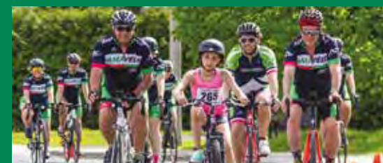
Triathlon de Saint-Amable