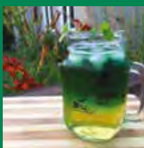
Oktoberfest de Verchères