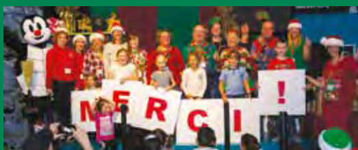
Fête de Noël de LEUCAN à Boucherville