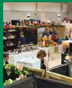
Foire commerciale de Verchères