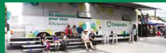
Fête au Vieux-Village à Sainte-Julie