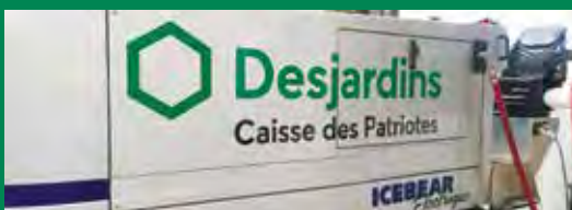
Surfaceuse au Sportplex de l'Énergie à Varennes