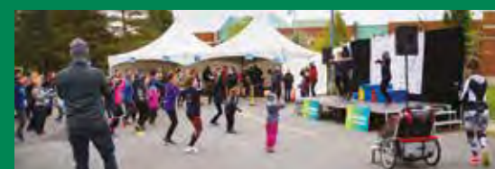
Je Bouge avec mon Doc de Sainte-Julie