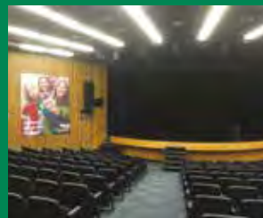
Inauguration de la Salle Desjardins de l'École secondaire De Montagne de Boucherville