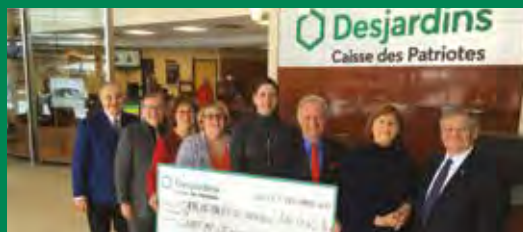
Maison du bénévolat du Centre d'Action bénévole de Boucherville (CABB)

30% de nos commandites, dons et FADM sont en lien avec la jeunesse.