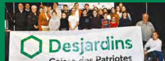
Remise de bourses du Club cyclistes Dynamiks de Contrecoeur