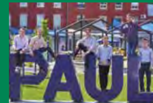
Fondation du Collège Saint-Paul