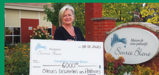
Fondation Source Bleue