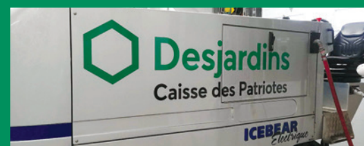
Surfaceuse au Sportplex de l'Énergie Varennes