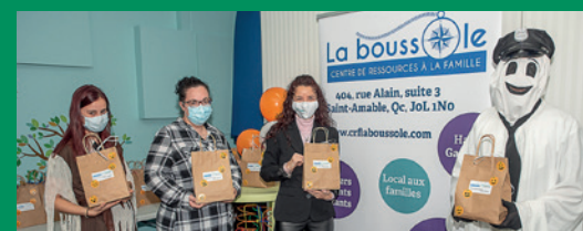
La Boussole de Saint-Amable