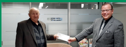
Société d'agriculture du Comté de Verchères