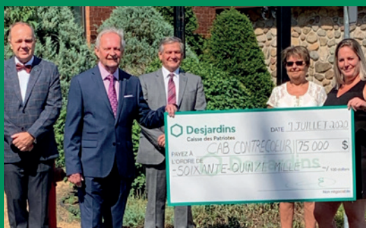
Centre Action bénévole de Contrecoeur