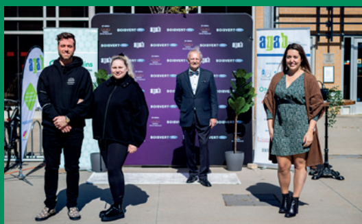
Gala Aimé-Racicot de l'AGAB de Boucherville