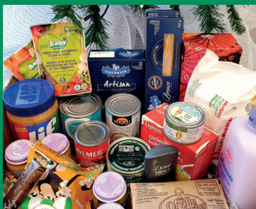
Collecte de denrées pour la guignolée