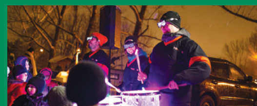
Fête du Lac de Sainte-Julie