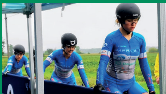
Club cycliste Dynamiks de Contrecoeur

70 % de nos commandites, dons et Fonds d'aide au développement du milieu (FADM) sont en lien avec la jeunesse.