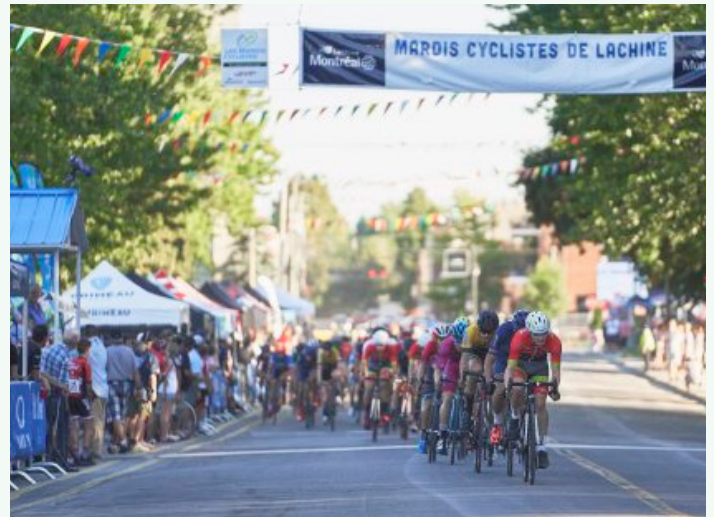
Un peloton de cyclistes motivés

La Caisse a été une fière partenaire des Mardis cyclistes de Lachine pour une onzième année. Événement incontournable pour les amateurs de vélos, Les Mardis cyclistes attirent les coureurs de haut calibre de partout au Québec.