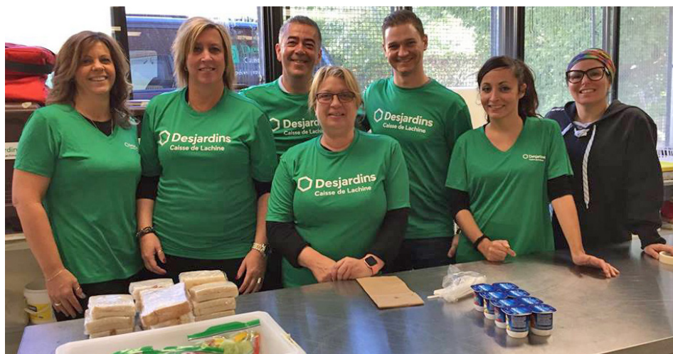
Nos cuisinots d'un jour ont concocté de bons petits plats pour les écoliers moins favorisés du secteur.

La Caisse de Lachine a participé à ce grand élan. Durant cette semaine, ses employés ont mis la main à la pâte au Relais populaire de Lachine en préparant des repas pour les jeunes de milieux moins favorisés fréquentant les écoles primaires lachinoises. Avec fierté, ils ont aussi mis les mains et les genoux dans la terre avec l'organisme environnemental GRAME en plantant des arbres sur les terrains de l'école secondaire Dalbé-Viau et de la Maison Mère des Sœurs de Sainte-Anne. Ces heures de bénévolat de la Caisse s'ajoutent aux nombreuses autres consacrées à plus de 200 projets par les employés et administrateurs du Mouvement Desjardins en octobre dernier.