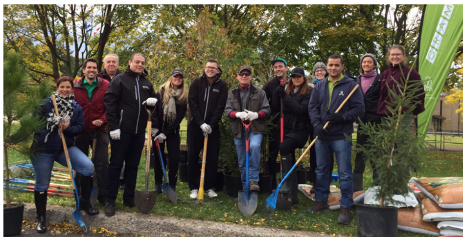
Armés de pelles et de râtaux, nos employés ont contribué au verdissement de notre arrondissement.