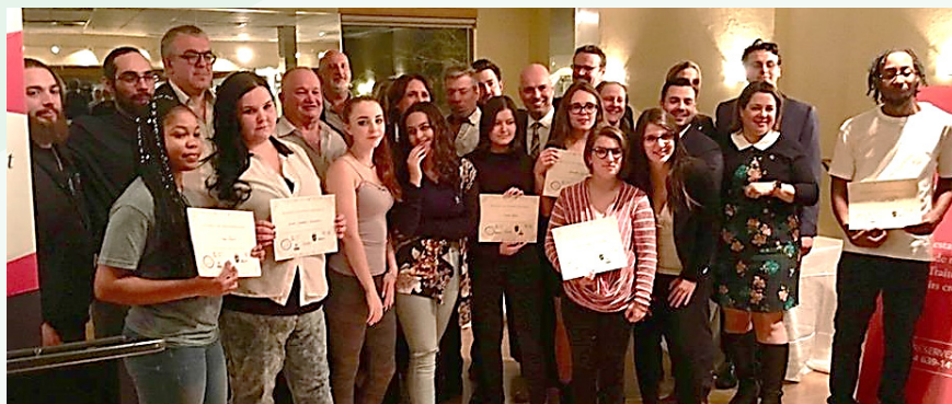
Des raccrocheurs qui ont vu leur ténacité récompensée!