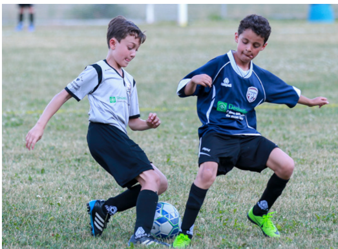
Partenaire de Soccer CDN.

Grâce aux dons et aux commandites, la Caisse a distribué 97 276 $ à des organismes de son territoire afin de les soutenir dans leurs activités, parmi ceux-ci, on retrouve : Outremont en famille, YMCA du Parc, la Maison Bleue, le Centre Philou, la Fondation de l'école Paul Gérin-Lajoie, le Théâtre Outremont, le Magasin-partage de la cafétéria communautaire Multicaf de Côte-des-Neiges, l'Académie de danse Outremont, Soccer Côte-des-Neiges.