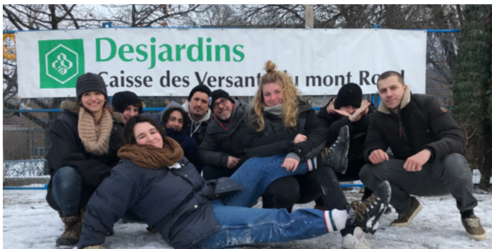
Soutien à la campagne de financement « Vente de sapins de Noël » de la Maison des Jeunes d'Outremont.