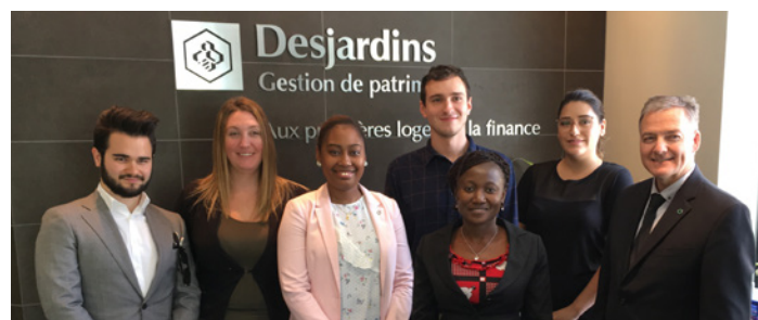
Boursiers de la Fondation Desjardins en compagnie de deux conseillères et du directeur général de la Caisse.

La Caisse et ses employés ont amassé 5 697 $ en soutien à la Fondation Desjardins et à Centraide. De plus, la Caisse a souligné en particulier l'accomplissement de six (6) boursiers de la Fondation Desjardins en leur remettant chacun un chèque allant de 1 500 $ à 3 000 $.