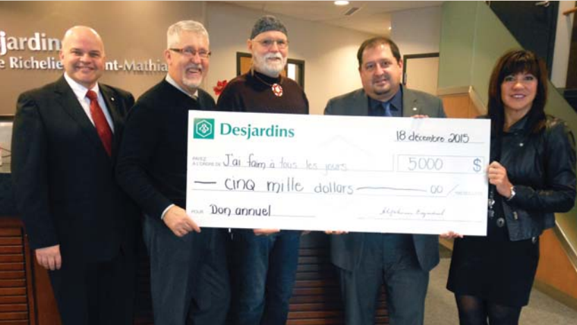
5 000 $ Fondation J'ai faim à tous les jours Don annuel