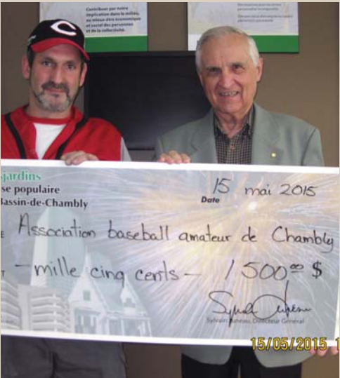
1 500 $ Association de baseball amateur de Chambly Soutien à l'organisation saison 2015