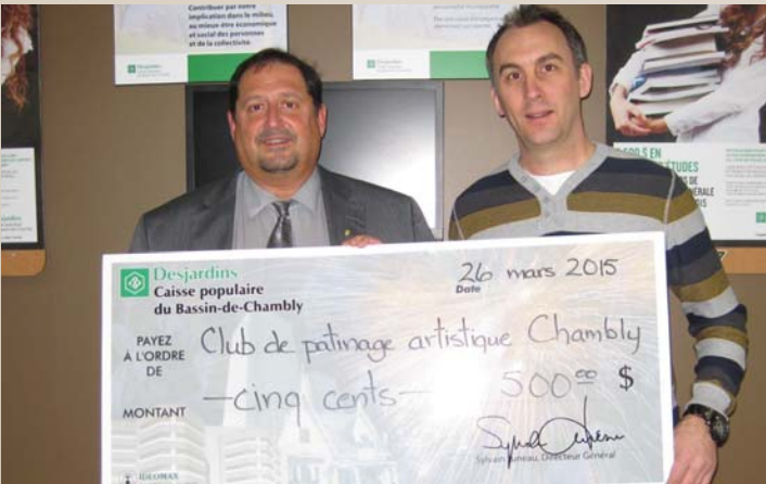
500 $ Club de patinage artistique de Chambly Revue sur glace 2015