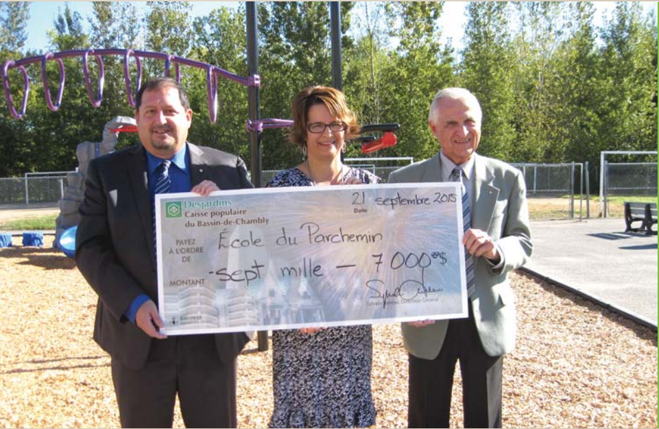
7 000 $ École du Parchemin Aire de jeux