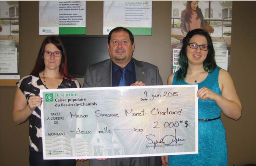
2 000 $ Maison Simonne Monet-Chartrand Soutien à l'organisme