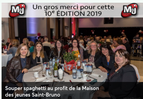
Souper spaghetti au profit de la Maison des jeunes Saint-Bruno