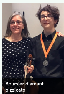
Boursier diamant pizzicato

pour soutenir 56 projets des organismes locaux touchant plusieurs milliers de personnes, des événements et des projets rassembleurs permettant de contribuer au bien-être de notre milieu. En voici quelques exemples :