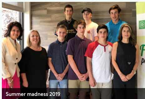
Summer madness 2019