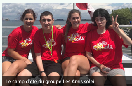
Le camp d'été du groupe Les Amis soleil

Une nouvelle terrasse dédiée à la clientèle de l'unité prothétique du Centre d'hébergement de Montarville a été inaugurée le 3 octobre dernier.