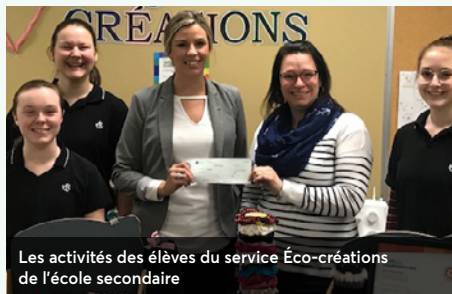
Les activités des élèves du service Éco-crétions de l'école secondaire

Des jeunes participent à l'activité parascolaire de création à partir d'objets recyclés. Cela permet d'acquérir des savoir-faire qui ne sont plus enseignés comme la couture et le crochet.