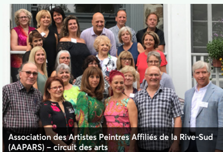
Association des Artistes Peintres Affiliés de la Rive-Sud (AAPARS) – circuit des arts