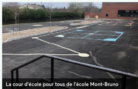
La cour d'école pour tous de l'école Mont-Bruno

Des jeunes participent à l'activité parascolaire de création à partir d'objets recyclés. Cela permet d'acquérir des savoir-faire qui ne sont plus enseignés comme la couture et le crochet.