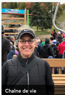
Chaîne de vie