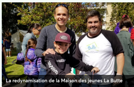
La redynamisation de la Maison des jeunes La Butte

Réalisé par les jeunes, ce moyen d'autofinancement favorise la participation, le sens de l'entrepreneuriat et le sens des responsabilités.