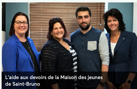
L'aide aux devoirs de la Maison des jeunes de Saint-Bruno

Camp de jour d'été offert à des jeunes de 5 à 25 ans ayant une déficience intellectuelle ou d'autres troubles du spectre de l'autisme.