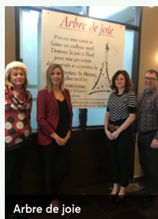
Arbre de joie