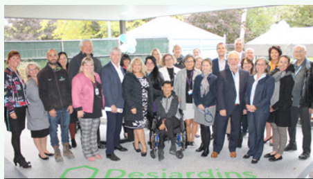
La Terrasse de l'unité prothétique du CHSLD Montarville

Une nouvelle terrasse dédiée à la clientèle de l'unité prothétique du Centre d'hébergement de Montarville a été inaugurée le 3 octobre dernier.