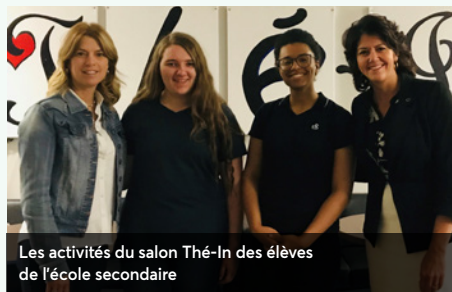
Les activités du salon Thé-In des élèves de l'école secondaire

Réalisé par les jeunes, ce moyen d'autofinancement favorise la participation, le sens de l'entrepreneuriat et le sens des responsabilités.