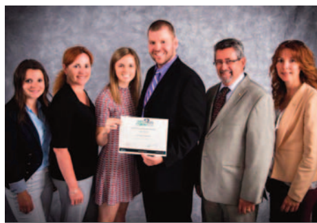
Bourses Mérite étudiant Cégep St-Jérôme