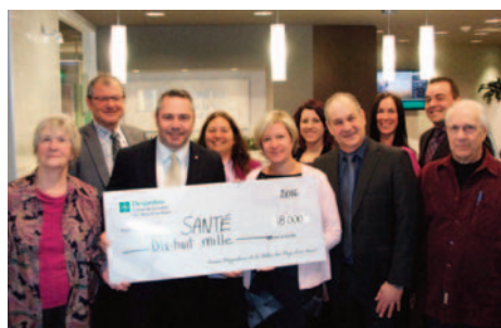
18 000 $ remis pour la santé

En 2016, la Fondation Desjardins a lancé les Prix #FondationDesjardins destinés aux intervenants des milieux scolaire et communautaire qui désirent réaliser un projet avec des jeunes d'âge primaire et secondaire. En plus d'octroyer des bourses permettant à des jeunes de poursuivre leurs études, la Fondation appuie aussi plusieurs programmes et organismes encourageant la persévérance scolaire comme le programme Persévère d'Éducaide et les guides Mon enfant, son avenir.