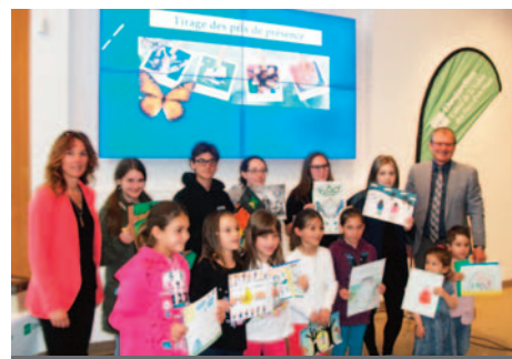
Concours de dessins 2016