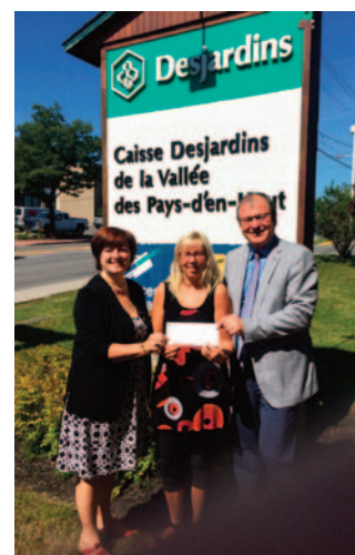
Réfection cour de l'École Chant-au-Vent