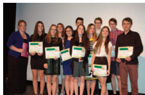
Bourses jeunesse 2016