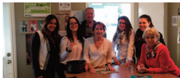
Maison des jeunes de Saint-Sauveur et Piedmont