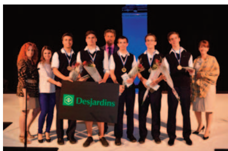
Bourses Académie Lafontaine