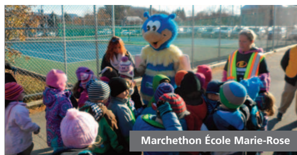
Marchethon École Marie-Rose