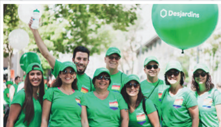
Défilé Fierté Montréal 2018

Pour faire la différence un geste à la fois!