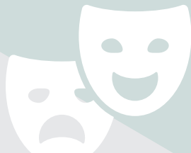
Fondation Pointe-à-Callière Tapis Rouge Exposition La Petite vie