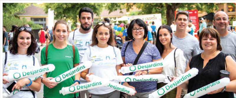
Fondation québécoise du cancer La marche du Grand déroulement