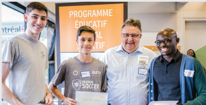
Services de loisirs St-Jacques de Montréal Programme Éleve Athlète

Pour encourager l'épanouissement individuel et collectif!