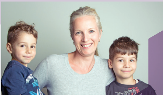
Ruelle de l'avenir Camps familiaux