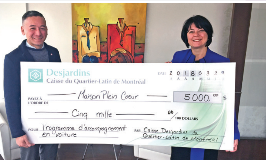
Maison Plein Cœur Service d'accompagnement en voiture