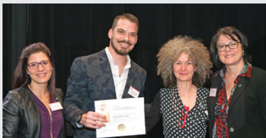
Fondation du cégep du Vieux Montréal Bourses d'études 2018