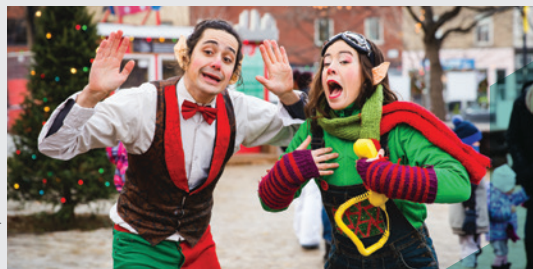
Auguste Théâtre Noël dans le Parc