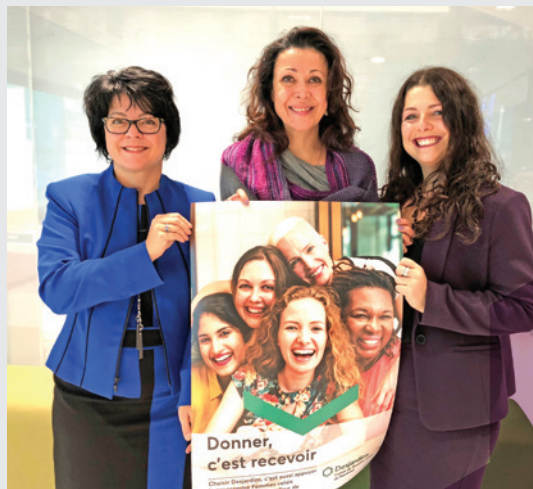
Carrefour de ressources en interculturel Femmes-relais interculturelles