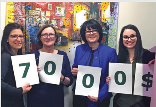
Auberge Madeleine Campagne annuelle

Afin de contribuer à l'amélioration de la qualité de vie de notre quartier!