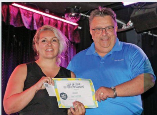
Festival Mtl en Arts Coup de cœur du public Desjardins

En participant à la vitalité de notre quartier!