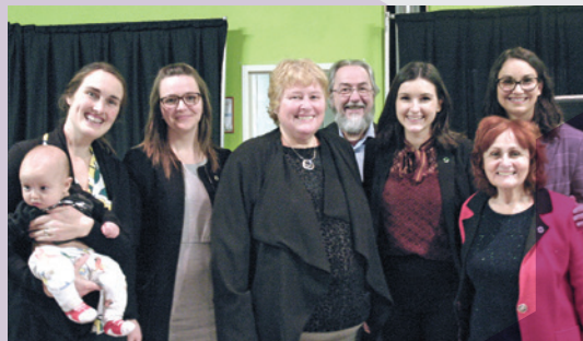
Centre Communautaire de loisirs Ste-Catherine d'Alexandrie Programme Desjardins d'hiver