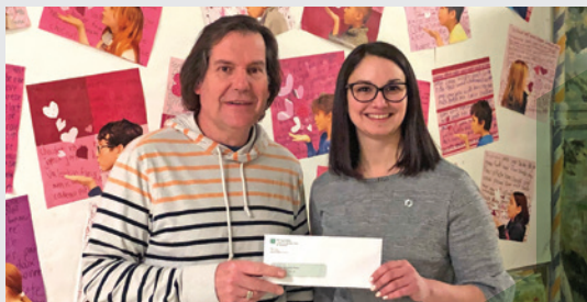
École Jean-Baptiste-Meilleur Cuisine collective