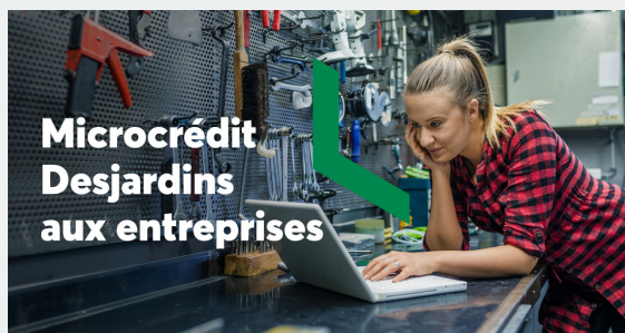
Microcrédit Desjardins aux entreprises

Avec le programme Créavenir, la Caisse, en collaboration avec des partenaires du milieu, soutient les entrepreneurs de 18 à 35 ans qui ne peuvent accéder au financement traditionnel. Nous leur offrons un financement flexible assorti d'une subvention pouvant être utilisée comme mise de fonds.