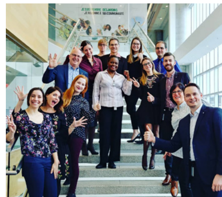
Quelques employés lors du premier vendredi décontracté.

Trois organismes ont bénéficié des montants accumulés par les employés de la Caisse lors des vendredis décontractés. En effet, chaque vendredi de l'année, en échange d'une somme de 1$, les employés bénéficient d'un allègement vestimentaire pour la cause choisie. Des petits gestes qui font toute la différence auprès des organismes de notre milieu.