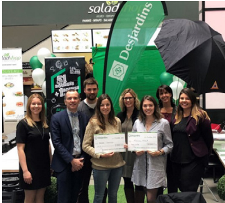
Deux étudiants lauréats lors de la remise de bourse

L'éducation est un principe fondamental du modèle coopératif qui est au cœur de notre mission. C'est pour cela que Desjardins a mis la persévérance scolaire et la réussite éducative à l'honneur durant la Semaine de la coopération 2018. C'est dans cette optique que 52 jeunes membres des territoires des caisses Desjardins de Cap-Rouge, de Sainte-Foy, de Sillery-Saint-Louis-de-France et du Plateau Montcalm ont reçu 85 000 $ en bourses d'études.