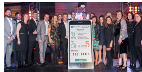
L'événement a permis d'amasser une somme record au profit de l'unité oncologique générale de l'Hôtel-Dieu de Québec.

l'accomplissement de la cause retenue. Son approche est de favoriser la participation par l'organisation d'activités rassembleuses, novatrices et uniques.