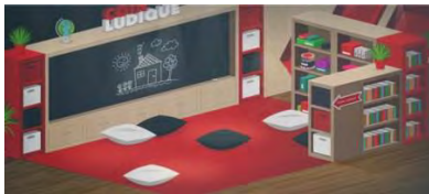
Projet gagnant du concours FADM, la bibliothèque Multi-usage de l'école Les Bocages.