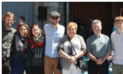
Le président du conseil d'administration en compagnie de quelques-uns des instigateurs du projet Espace Parvis et de partenaires lors du lancement des activités.

La Caisse a également annoncé un support à deux coopératives, soit ; la Coopérative jeunesse de services la Cité-Limoilou et les Ateliers la Patente pour un projet de financement novateur. Finalement, le programme Tournesol du Centre de plein air Le Saisonnier, le Centre Cyber-aide, la Société de Saint-Vincent de Paul de Québec, le Comité de volontariat du Quartier Limoilou-Sud, l'Ensemble vocal Chanterelle et la Paroisse Notre-Dame de Rocamadour ont également obtenu un support pour leurs activités.