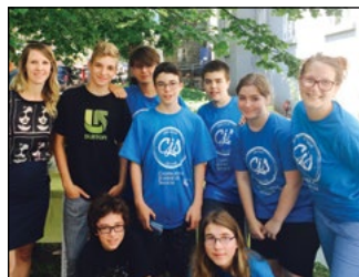
Une partie de l'équipe de la Coopérative jeunesse de services en compagnie de la conseillère en communication lors du lancement de la saison.