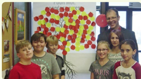
École de la Francolière

Une journée entièrement dédiée à la persévérance scolaire a également eu lieu à l'école secondaire Louis-Jacques-Casault en plus de la tenue d'un kiosque Avantages membre Desjardins.