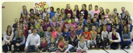
École des Tilleuls