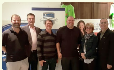
Association de Soccer des Premières Seigneuries