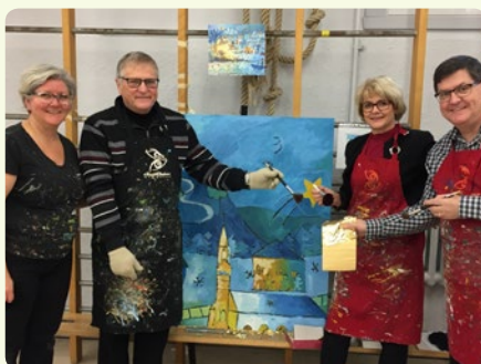
Fresque à l'école de Saint-Joachim réalisée par l'ensemble des jeunes et des partenaires associés à ce projet, avec le support de Murale Création.

COOPÉRER CHAQUE JOUR POUR LE DESJARDINS DE DEMAIN