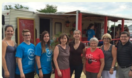
La Coopérative Jeunesse de Services de la Côte-de-Beaupré