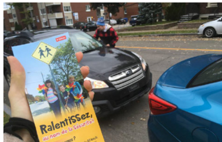
Merci à Solidarité familles et sécurité routière - Santé et sécurité de mettre de l'avant l'importance de ralentir aux abords des écoles!