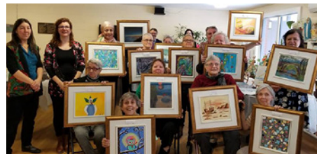
Les Pinceaux d'Or lors du vernissage à l'OMHQ Émile-Robitaille.