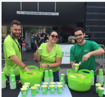
La brigade jeunesse en action lors de Saint-Sacrement en fête.