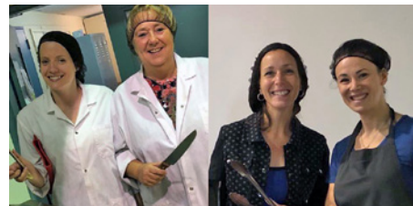
Une matinée d'intercoopération aux déjeuners populaires de La Baratte, en compagnie d'employés des caisses Desjardins du Plateau Montcalm et de Sainte-Foy, lors de la Semaine de la coopération.