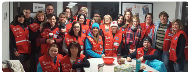
Plus d'une trentaine d'employés ont sillonné les routes du comté afin de raccompagner, en toute sécurité, les citoyens de la région à titre de bénévoles pour Opération Nez Rouge Portneuf.

Les employés des caisses de la région de Portneuf contribuent à la vitalité de leur communauté en faisant du bénévolat chaque année.