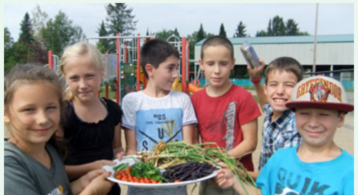
Poursuite du projet de jardinage avec les enfants du service de garde et du terrain de jeux.

Votre Caisse est fière d'avoir remis un montant de 2 000 $ au Comité d'embellissement de Saint-Léonard pour poursuivre l'aménagement de la promenade près du bureau municipal de même que le réaménagement de la plate-bande de la rue Principale face à l'Église.