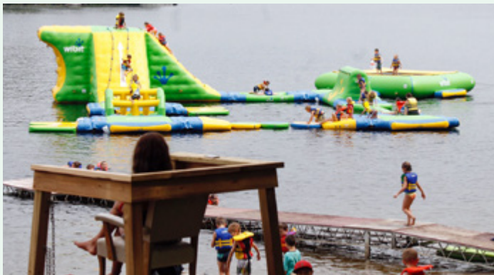
Une façon amusante de bouger en famille.

Depuis juillet 2017, les jeunes et les familles peuvent profiter d'une attraction unique en son genre sur le site de la base plein air du Camp de Portneuf : le Défi aquatique Desjardins! Ce tout nouveau parcours d'habileté est une première dans la région et suscite déjà énormément d'intérêt! Tenterez-vous le défi en famille à l'été 2018?