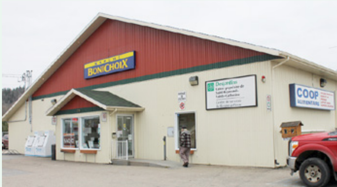
Les nouveaux locaux de la coopérative d'alimentation.

La Coopérative d'alimentation a pu bénéficier d'une somme de 20 000 $ dans le cadre de son projet d'agrandissement visant à offrir une plus grande diversité d'aliments en plus de mets préparés aux familles. Un très beau projet pour la communauté!