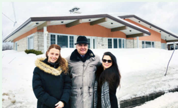
Un espace plus grand pour les cuisines collectives, un plus grand stationnement et la possibilité d'accueillir d'autres organismes.

Après avoir vécu deux inondations dans les locaux que le Carrefour FM louait depuis 2007, il était devenu primordial pour l'organisme de se relocaliser afin de continuer d'offrir leurs services à la population. Grâce à une contribution de 30 000 $ de Desjardins, l'organisme possède maintenant sa propre maison leur permettant ainsi d'aider les familles monoparentales, les familles recomposées ainsi que les personnes seules de la région de Portneuf.