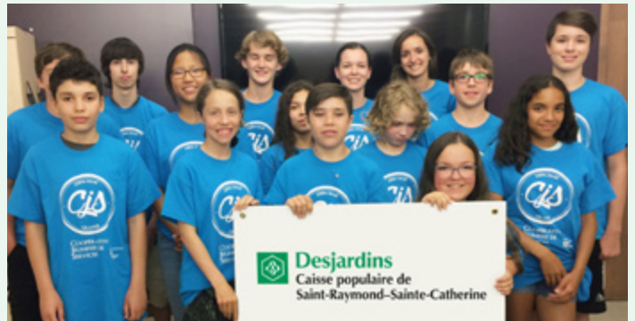
Cohorte de jeunes 2017

Grâce à la mobilisation de la Ville de Sainte-Catherine, au Carrefour jeunesse emploi Portneuf et à votre Caisse, une deuxième Coopérative jeunesse de services a pu voir le jour à l'été 2017 sur le territoire de la Caisse. Cela a permis à une dizaine de jeunes de vivre leur toute première expérience d'emploi d'été, tout en créant leur propre coopérative!