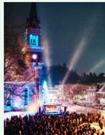
Une année mémorable pour Saint-Raymond.

Dès le 31 décembre 2016, une grande cérémonie a réuni des centaines de citoyens pour lancer les festivités! Toute l'année, votre Caisse a participé aux activités spéciales organisées en l'honneur du 175 e anniversaire de la ville. À titre de partenaire majeur de l'événement, votre Caisse a contribué à la réalisation de dizaine de spectacles, activités familiales et feux d'artifices qui auront certes marqués la mémoire des Raymondais et Raymondaises!