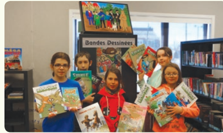
Élèves de l'école de la Passerelle de Notre-Dame-de-Montauban à la bibliothèque municipale de Notre-Dame-de-Montauban

Les élèves de l'école de la Passerelle se déplacent à raison d'une demi-journée par semaine à la bibliothèque municipale afin de faire du travail de recherche, ainsi que pour se procurer des livres selon leurs intérêts. La Caisse Desjardins de l'Ouest de Portneuf est fière de contribuer financièrement à l'achat de livres pour la bibliothèque.