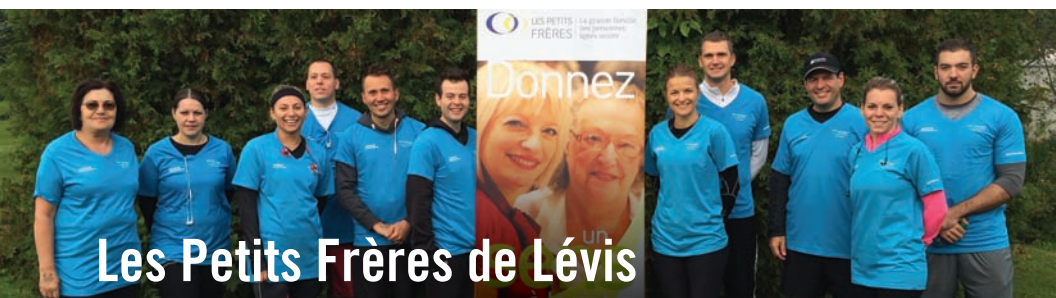
Nos collègues de la Caisse qui ont parcouru 5 ou 10 km au profit des Petits Frères de Lévis.

Les Petits Frères accompagnent les personnes seules du grand âge, afin de contrer leur isolement. 2016 aura été l'occasion pour les 3 caisses situées à Lévis d'assurer la pérennité de l'organisme nouvellement installé sur notre territoire. Plusieurs employés de notre caisse ont également participé à la « Marche des générations », lors de la Journée internationale des personnes âgées le 1 er octobre 2016.