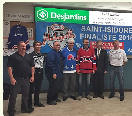
Sur la photo : les membres du comité organisateur de l'événement.

Le 2 octobre 2016, la municipalité de Saint-Isidore a été l'hôte d'un match affrontant les Anciens Canadiens de Montréal et les joueurs de la région. Une somme de 5 000 $ a été remise pour la réalisation de cet événement, dont les profits étaient entièrement dédiés à l'aréna de Saint-Isidore.