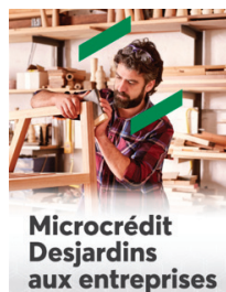
Microcrédit Desjardins aux entreprises