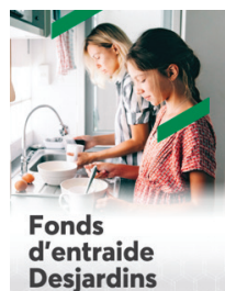
Fonds d'entraide Desjardins