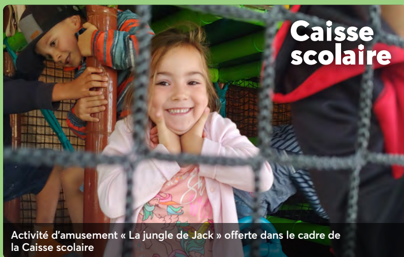
Activité d'amusement « La jungle de Jack » offerte dans le cadre de la Caisse scolaire