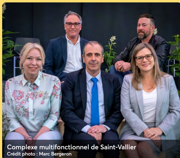
Complexe multifonctionnel de Saint-Vallier