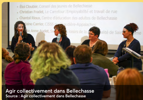
Agir collectivement dans Bellechasse