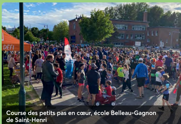
Course des petits pas en cœur, école Belleau-Gagnon de Saint-Henri