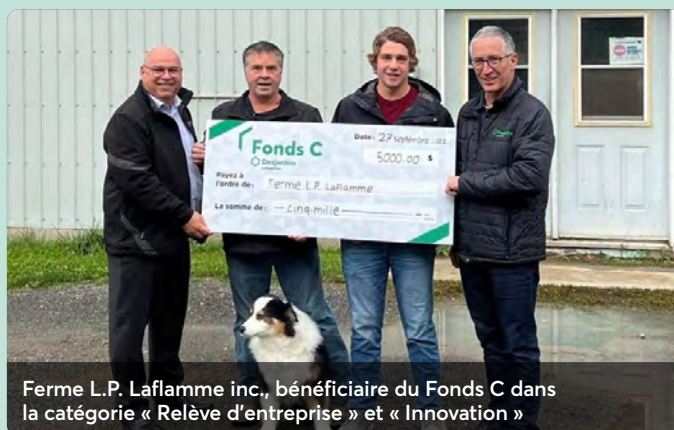
Ferme L.P. Laflamme inc., bénéficiaire du Fonds C dans la catégorie « Relève d'entreprise » et « Innovation »