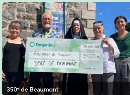
350 e de Beaumont