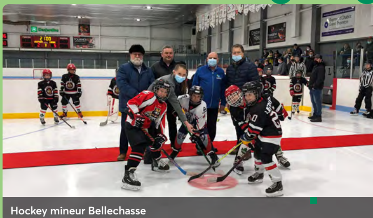
Hockey mineur Bellechasse