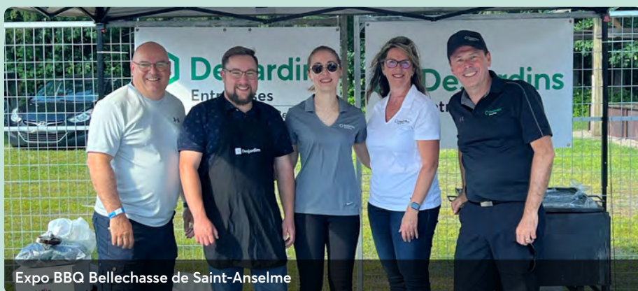
Expo BBQ Bellechasse de Saint-Anselme

Présents pour aider les entreprises dans la réalisation de leurs projets.