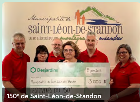
150 e de Saint-Léon-de-Standon