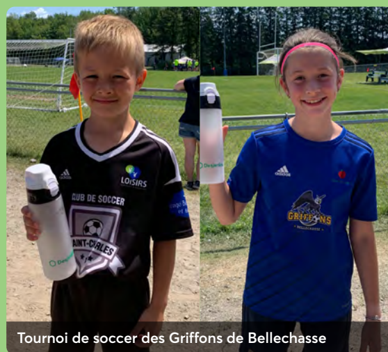
Tournoi de soccer des Griffons de Bellechasse