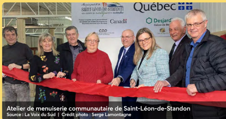
Atelier de menuiserie communautaire de Saint-Léon-de-Standon