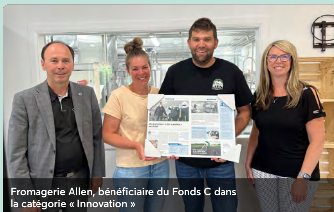
Fromagerie Allen, bénéficiaire du Fonds C dans la catégorie « Innovation »

« Nous sommes impliqués dans la croissance de votre entreprise! »