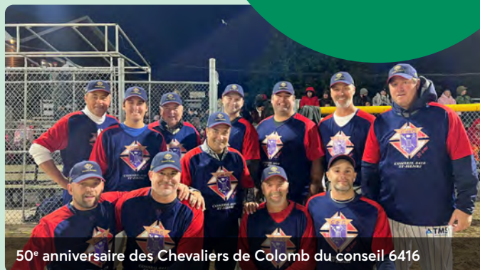
50 e anniversaire des Chevaliers de Colomb du conseil 6416