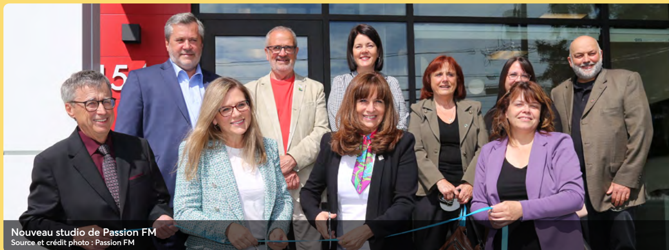
Nouveau studio de Passion FM

Grâce à vous, nous contribuons au développement de notre milieu!