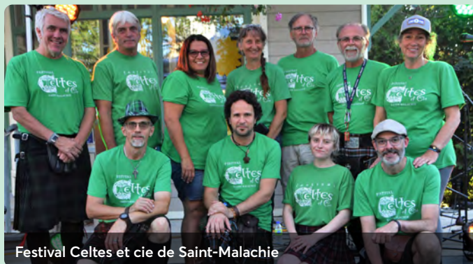
Festival Celtés et cie de Saint-Malachie

Par leur implication bénévole dans la communauté, les administrateurs et les employés de Desjardins démontrent leur engagement dans leur milieu.