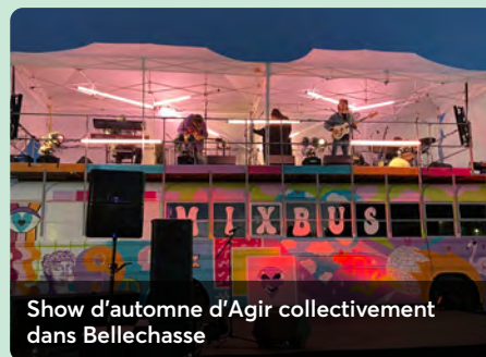
Show d'automne d'Agir collectivement dans Bellechasse

La distinction coopérative, c'est aussi appuyer de nombreux organismes qui nous tiennent à cœur