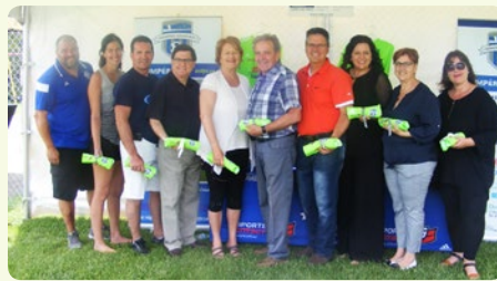
Sur la photo : Les partenaires du milieu entourés de membres de l'Association.

Une contribution financière de 5 000 $ a été offerte par la Caisse, en partenariat avec les caisses Desjardins de La Côte-de-Beaupré et de L'Île-d'Orléans, afin de permettre à l'Association d'offrir les chandails aux joueurs de soccer. Présente sur les territoires de la Côte-de-Beaupré et de Beauport, l'Association permet aux jeunes de pratiquer leur sport favori tout au long de l'été. Ce partenariat est une preuve significative du soutien du Fonds d'aide au développement du milieu auprès des organisations sportives de la communauté et de la force de notre coopérative et de ses avantages.