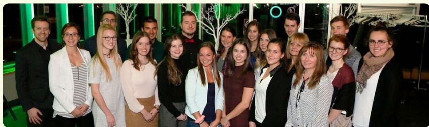
Sur la photo : Les lauréats de la soirée accompagnés des animateurs, des conseillères jeunesse ainsi que de la conseillère en communication.

À l'occasion de son Gala d'excellence du 22 novembre 2016, la Caisse, en collaboration avec la Fondation Desjardins, a remis plus de 30 000 $ en bourses à ses jeunes membres afin d'encourager leur persévérance scolaire et leur initiative dans différents projets. La Caisse est fière de supporter, par l'entremise de son Fonds d'aide au développement du milieu, ses membres dans leur cheminement scolaire et ainsi pouvoir leur offrir un levier financier pour leurs études.