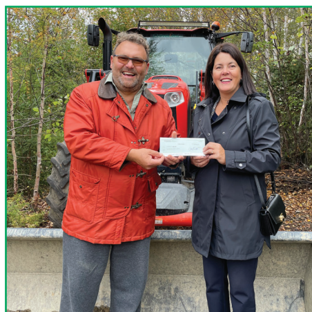
Soutien au Club Quad de la rivière Daaquam pour l'achat d'équipements.