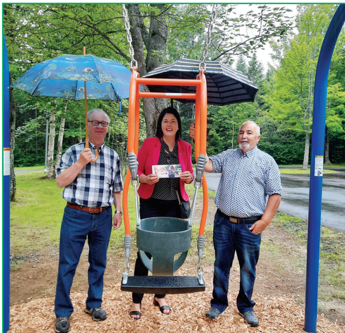
Inauguration d'une balançoire parent-enfant à Saint-Cyprien.