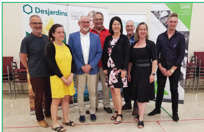
Lancement du projet de sentiers intermunicipaux des Etchemins.