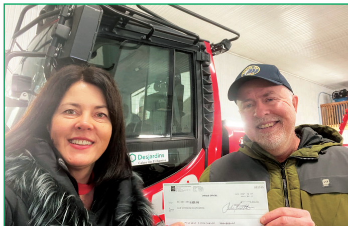
Partenariat avec le Club motoneige des Etchemins.