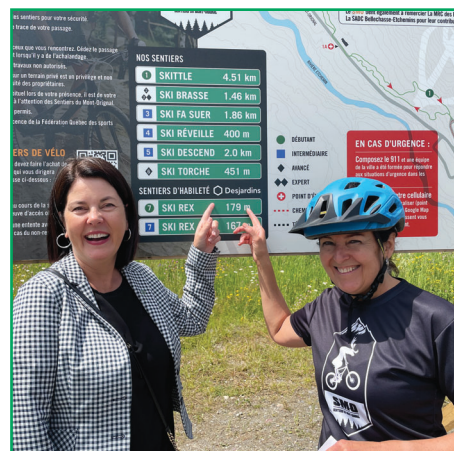
Partenaire des Sentiers de vélos de montagne au Mont-Original.