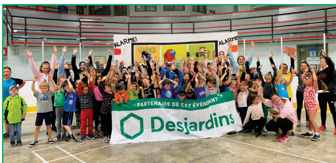
Les Olympiades Desjardins disputées entre les terrains de jeu de Sainte-Justine et Lac-Etchemin.