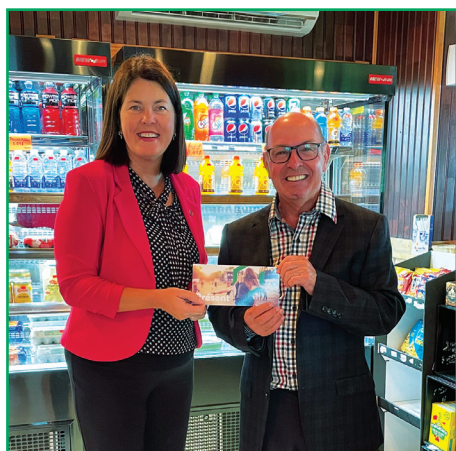
Partenaire avec l'Épicerie Pop lors de son souper-bénéfice.