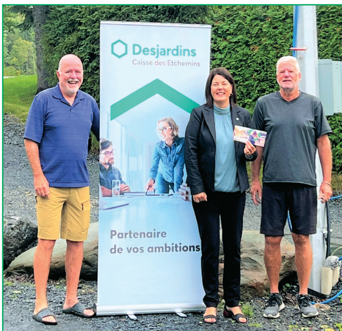
Partenariat avec l'Association nautique du lac Etchemin.