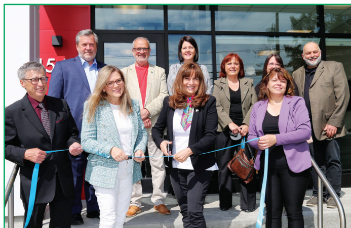
Inauguration du nouveau studio de Passion FM.