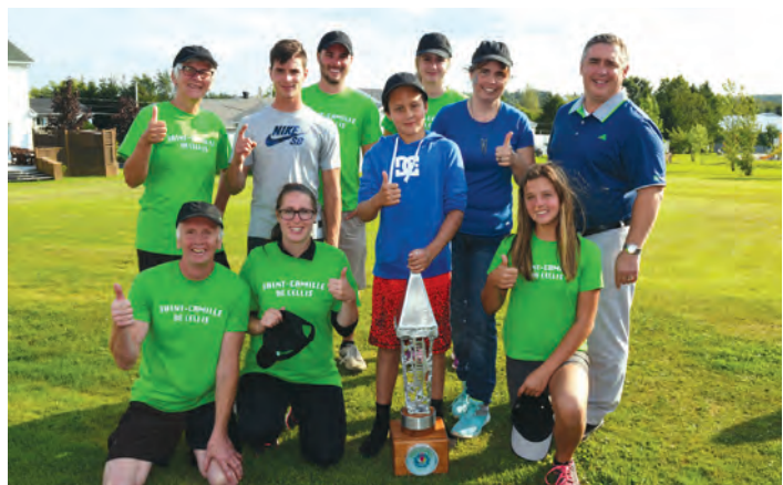
L'équipe victorieuse de Saint-Camille avait reçu les Jeux l'an dernier.

Cette année, les Jeux se dérouleront le 1 er septembre à Saint-Magloire.